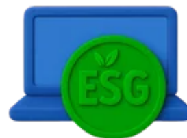
Locação com ESG