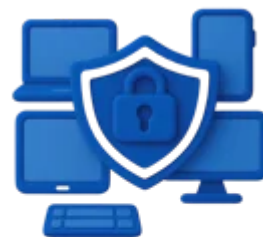
Proteção Total ou Compartilhada