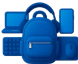
Gestão de Kits Welcome Aboard