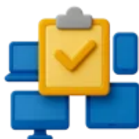
Tercerização da Gestão de dispositivos